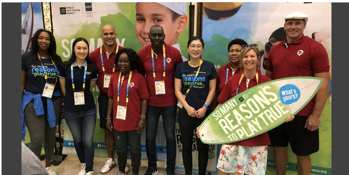
WADA's Outreach team engages athletes around Clean Sport during the 2019 ANOC World Beach Games in Doha, Qatar

In the face of the pandemic, I am proud to say that a lot has been achieved by the global anti-doping community. Testing and other activities have been back to normal levels since the start of 2021. This gave us the preparation time we needed for the Olympic and Paralympic Games in Tokyo.