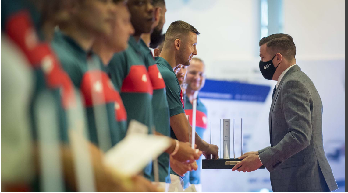
Witold Bańka, Polonya Olimpiyat Komitesinin Tokyo 2020 Oyunları yemin töreni esnasında Polonyalı sporcularla birlikteyken

WADA Küresel dopingle mücadele çalışmalarının düzenleyicisi ve denetçisi olarak büyük ölçüde soruşturma ve uyumlulukta kat edilen gelişmeler ve ayrıca gerçekleştirmiş olduğu geniş kapsamlı yönetim reformları sayesinde eğitim faaliyetlerini önemli derecede geliştirmiştir.