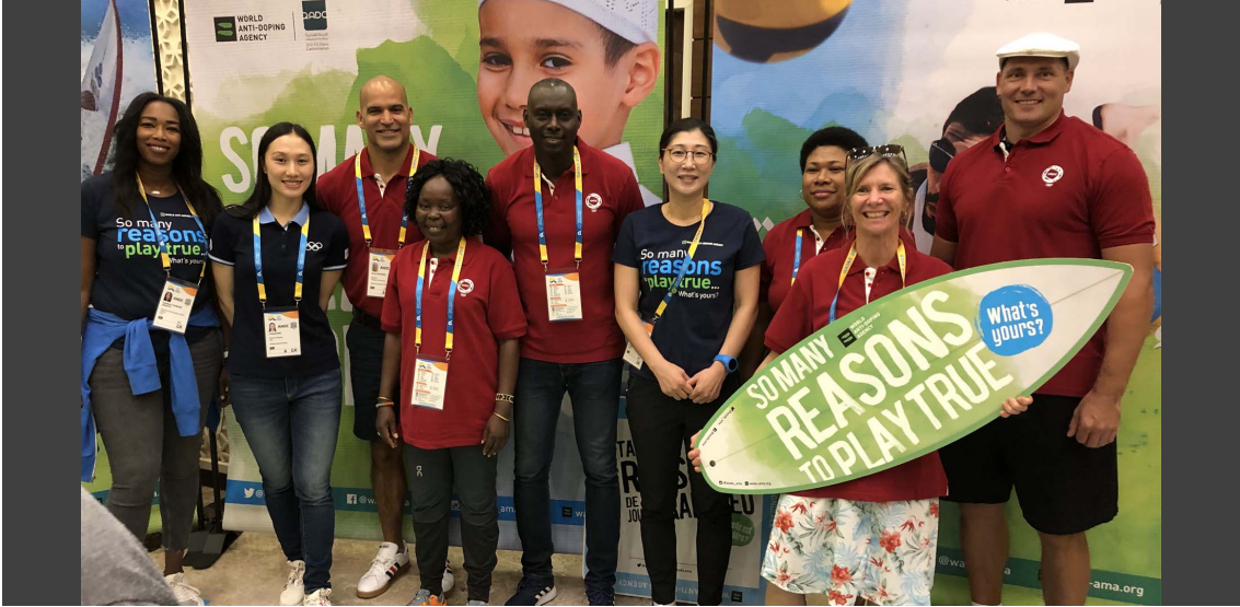
WADA'nın Sosyal Yardım ekibi Doha, Katar 2019 ANOC Dünya Plaj Oyunları esnasında Temiz Spor kapsamında sporcularla bir araya gelirken

Pandemi karşısında küresel dopinge mücadele topluluğu tarafından çok fazla şeyin başarıldığını onur duyarak söyleyebilirim. 2021'in başlarıyla birlikte doping testi ve diğer aktiviteler normal seviyelerine dönmüştür. Bu bize Tokyo Olimpiyat ve Paralimpik Oyunlarına hazırlık süresi tanımıştır.